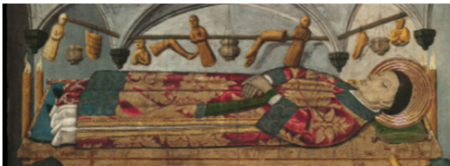
Figura 5.: Representación del yacente y exvotos en el sepulcro de San Vicente Mártir.

Ya retornando nuevamente al retablo del sepulcro de San Vicente Mártir, como ejemplo se deben tener en cuenta algunos detalles para su correcta interpretación dentro de su contexto y su función. Primeramente, la relevancia que poseerá este santo dentro de la corona de Aragón junto con San Lorenzo y Esteban, lo que justificará las advocaciones reiteradas a su nombre, como también las referencias taumatúrgicas en los retablos locales incluidas en el marco político y geográfico de dicha corona. Sabiendo que la representación corpórea del sepulcro incluía un valor simbólico agregado, no es de extrañar que "el desarrollo de efigies yacentes en el arte funerario permitía asociar de manera mucho más intensa la representación del santo a la fisticidad de sus restos" 21 , lo que daba lugar a una aproximación visual más figurativa en la mente del fiel sobre el santo. En este caso, se recrea como un sepulcro dorado elevado y sustentado sobre columnas similares a los observados anteriormente. En el caso de San Vicente cuenta con elementos geométricos y posiblemente vegetales casi desdibujados. En un segundo nivel, la representación de la figura escultórica yacente del santo, con nimbo y una túnica aterciopelada donde destacan los colores rojos y dorados, su rostro posee un acabado entre lo naturalista e idealista referencial en la forma de definir los rasgos de santos del reconocido taller que lo realizó 22 .