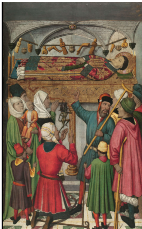
Figura 1. Tabla de los Milagros ante la Tumba de San Vicente Mártir en Sarrià.

Lo que se intenta demostrar es la variedad de milagros que podía realizar el santo, siendo los pobres y enfermos los protagonistas en esta obra, a pesar de que tras el análisis de las vestimentas se haya corroborado que sus indumentarias eran propias de la moda de su época 10 y que no hacen referencia