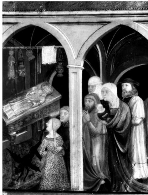
Figura 6. Sepulcro de San Esteban en el retablo de Castellar del Vallès

en la materialidad orgánica como en la práctica litúrgica de portarlo encendido hasta el sepulcro del santo. Aunque, igualmente, el mismo objeto céreo podía contener un carácter de duelo ante la muerte del santo dentro del ciclo narrativo de la representación de su vida en el retablo. Así queda demostrado en la lectura paralela de dos tablas partes del retablo de Santa Quiteria en Alquezar