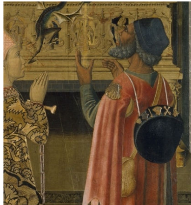
Figura 9. Peregrino frente al sepulcro de San Esteban