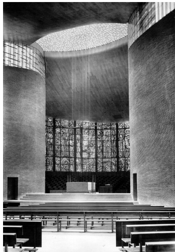
Fig. 4. Iglesia del Teologado dominico San Pedro Mártir de Alcobendas.