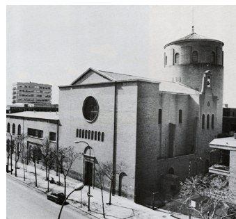
Fig. 3. Iglesia del Espíritu Santo.