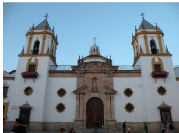
Fig. 2. Iglesia de Nuestra Señora del Socorro.