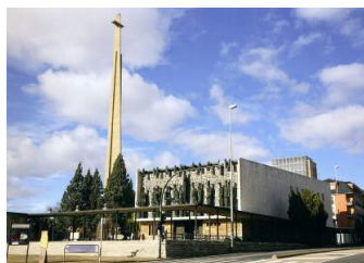
Fig. 5. Santuario de la Virgen del Camino.